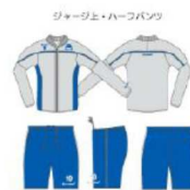
ジャージ上・ハーフパンツ