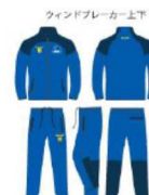
ウインドブレーカー上下