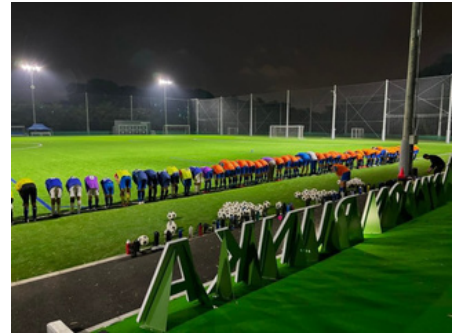
NICHIBUN SAKURA FIELD