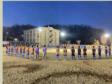
大学セミナーハウス