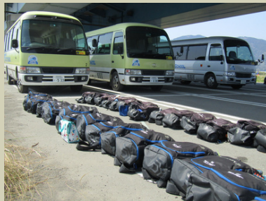
マイクロバス送迎(遠征)