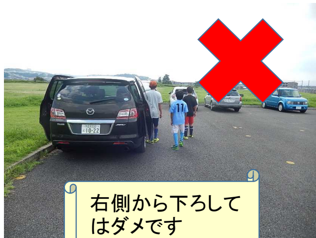
右側から下ろしてはダメです