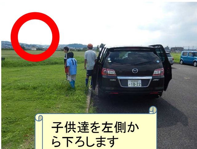
子供達を左側から下ろします