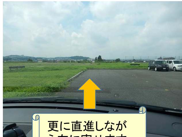
更に直進しながら左に寄せます