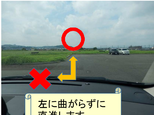
左に曲がらずに直進します