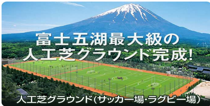
人工芝グラウンド(サッカー場・ラグビー場)

但し！ 試合が再開したら観戦しましょう！ 勢いで盛り上がりすぎないようにご協力ください！