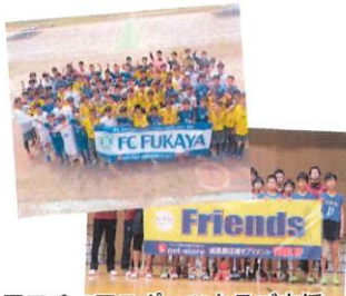
アマチュアスポーツクラブ支援 青少年育成活動

事業を通じて、アマチュアスポーツクラブの支援や選手への栄養サポート、青少年の育成活動、被災地支援活動など、子供の成長や人々の健康に携わる活動を続けています。